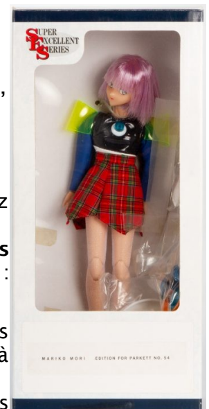
Mariko MORI « Star Doll »

Cet Objet sera ENTIÈREMENT vous ! Dans sa forme, ses couleurs, ses matériaux, ... Vous devrez être capable d' expliquer vos choix .