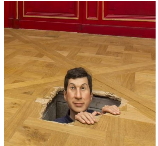
CATTELAN « Autoportrait » 2016