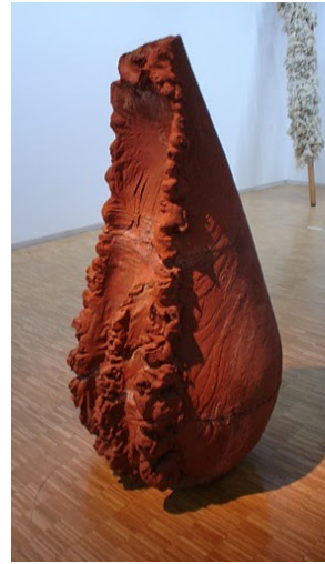
PENONE « Souffle 6 » 1978