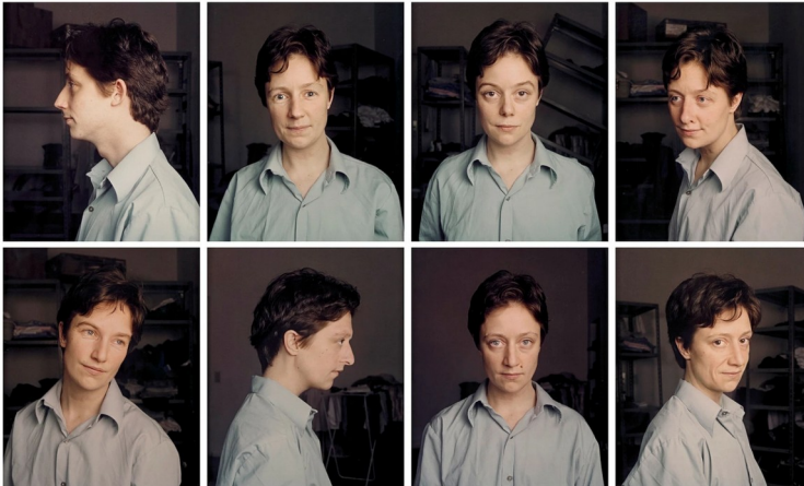
Vibeke TANDBERG « Faces » 1998

L' autobiographie est le récit d'un individu raconté par lui-même, qu'il soit écrivain ou non.